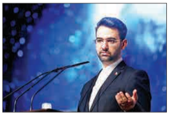
تعطیلی گسترده در انتظار شرکت‌های حوزه فناوری

وزیر ارتباطات می‌گوید ۶۲ درصد از شرکت‌های حوزه فناوری به دلیل آسیب ناشی از ویروس کرونا فقط می‌توانند سه ماه دیگر به فعالیت خود ادامه بدهند. به گزارش ایرنا، محمد جواد آذری جهرمی با اشاره به اینکه تاب‌آوری شرکت‌ها در شرایط فعلی بسیار اندک است، گفت: «۶۲ درصد شرکت‌های حوزه ارتباطات کمتر از سه ماه دیگر می‌توانند شرایط فعلی را تاب بیاورند، ۶ درصد نهایتاً ۶ ماه و ۳۲ درصد باقی مانده تا پایان سال ممکن است بتوانند به فعالیت خود ادامه بدهند.» جهرمی افزود: «تأثیر منفی کرونا بر ۷۲ درصد کسب و کارها کاملاً مشهود بوده است و اغلب آنها دست به تعدیل نیرو زده‌اند البته در این بین کسب و کارهای حوزه پزشکی توانسته‌اند به رشد خوبی دست پیدا کنند. به گفته وزیر ارتباطات ۵۱ درصد شرکت‌ها به دلیل از بین رفتن تقاضا دچار چالش شده‌اند، ۳۲ درصد دلیل مشکلاتی که در زنجیره ارزش به وجود آمده مشکل خوردند و ۳۷ درصد هم به دلیل اینکه نیروهایشان ترجیح دادند سر کار حاضر نشوند، مشکلات زیادی داشتند. جهرمی با تأکید بر اینکه نخستین چالش کسب و کارها «پرداخت بیمه، مالیات، اجاره بها و یا زبردخت و وام‌های بزرگ مشکلات بزرگ کسب و کارهاست. شرکت‌هایی مانند اسنپ و تپسی طی این مدت ۷۰ درصد کاهش سفر داشته‌اند و با اینکه در این روزها سفارش‌شان ۲۰ درصد برنگشته‌اند.»