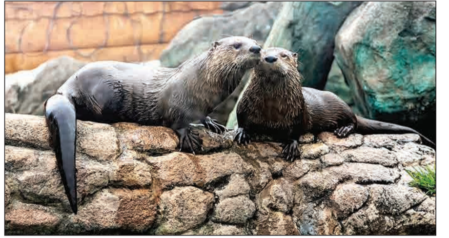
برگردان از thefactsite

در چنین روزی، برابر بیست و سوم ژوئن ۱۹۸۹ میلادی، میشل عفلق، بنیانگذار حزب بعث در پاریس درگذشت. عفلق که مسیحی ارتدوکس بود، اساس تفکر حزب بعث را بر پایه ناسیونالیسم عربی بنیان گذاشت. او فعالیت سیاسی خود را در زادگاهش سوریه آغاز کرد، اما در ادامه با نظام حاکم دچار مشکل شد و به دعوت صدام حسین که حزب بعث سوریه را رقیب حزب بعث عراق می‌دید، راهی بغداد شد. عفلق بعدها ادعا داشت که حزب بعث عراق هیچ اهمیتی به نظرات او نمی‌داد و آن‌ها را احترام‌های ظاهری نیز بیشتر در راستای دهن کجی به حزب بعث سوریه و شخص حافظ اسد انجام می‌شد.