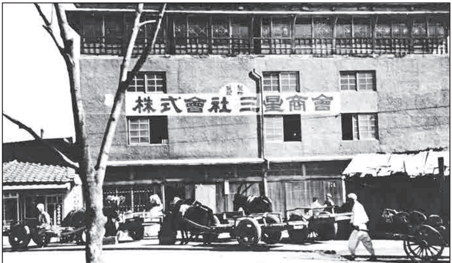
دقتر تجارت میوه، سبزیجات و ماهی سامسونگ - ۱۹۳۸