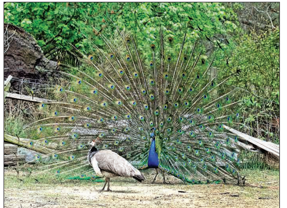
برگردان از thefactsite

[شهرود] بیش از دوهزار سال است که در سرتاسر جهان، طاووس ها برای اهداف سرگرم کننده یا مذهبی، اسیر شده و در قفس ها و پارک ها نگهداری می شوند. واژه «طاووس» با آن شکل و شمایل باشکوه و پرهایی زیبا، فقط برای گونه نر این پرنده به کار برده می شود و ماده ها به دل فریبی نرها نیستند! طاووس های ماده، سه گونه مختلف دارند که دوتای آن آسیایی و دیگری از نژاد آفریقایی است. از اصلی ترین تفاوت های طاووس های نر و ماده، اندازه آنهاست؛ اندازه طاووس های نر تقریباً دو برابر ماده هاست. طاووس های آفریقایی با عنوان «طاووس کنگو» نیز شناخته می شوند و اطراف رودخانه کنگو زندگی می کنند. گونه های آسیایی هم طاووس های هندی و طاووس های سبز هستند. طاووس ها در ابتدا در جنگل ها، خصوصاً جنگل های بارانی زندگی می کردند، محیط و طبیعتی که همچنان راحت ترین زیستگاه برای آنهاست. این پرنده از تیره قرقاولیان است. ۱- طاووس های اهلی، که در محیط های حفاظت شده نگهداری می شوند، بعضاً تا ۵۰ سال عمر می کنند. اما زندگی برای طاووس هایی که در طبیعت و حیات وحش هستند، خطرناک تر است و آنها معمولاً بیشتر از ۲ سال دوام نمی آورند. ۲- میانگین سرعت دویدن طاووس، ۶ کیلومتر در ساعت است. گاهی دیده می شود که طاووس ها در حال پرواز به سوی درخت ها هستند. آنها این کار را می کنند تا جان شان را از گزند شکارچی ها در امان نگه دارند. ۳- همه گونه های طاووس روی سرشان کاکل دارند. حال طرح و رنگ این کاکل ها ممکن است در بین گونه ها و جنس های مختلف، متفاوت باشد. ۴- طاووس ها از زندگی تنهایی هیچ لذتی نمی برند و تمایل