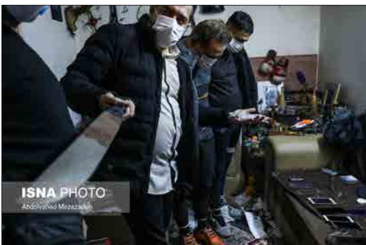
ایسنا- پنجشنبه شب گذشته در عملیاتی پلیسی مأموران کلانتری ۱۵۱ یافت آباد باتوقی را که از سوی مالخران و مواد فروشان به محلی برای رفت و آمد سارقان و افراد معتاد بدل شده بود، منهدم کردند. در این پاتوق به گفته سرهنگ جلیل موقوفه‌ای، رئیس پلیس پیشگیری پایتخت ۶ نفر دستگیر شدند و دست کم ۱۰ میلیارد ریال اموال مسروقه و یک کیلوگرم مخدر شیشه کشف شد.