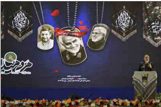
باشگاه خبرنگاران جوان- مراسم سالگرد شهادت مظلومانه سیدالشهدای مقاومت اسلامی، حاج قاسم سلیمانی پنجشنبه هجدهم دی ۱۳۹۹ با حضور سردار سلامی فرمانده کل سپاه، شیخ اکرم کبکی دبیرکل جنبش نجبا عراق، خانواده معظم شهید و میهمانان داخلی و خارجی در مصلى بزرگ امام علی کرمان برگزار شد.