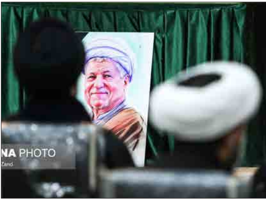
ایسنا- مراسم چهارمین سالگرد درگذشت آیت الله هاشمی رفسنجانی رئیس اسبق مجمع تشخیص مصلحت نظام پنجشنبه هجدهم دی ماه با حضور اعضای خانواده ایشان، سیدحسن خمینی و برخی مقامات کشوری در حرم مطهر بینا نگار جمهوری اسلامی ایران برگزار شد.