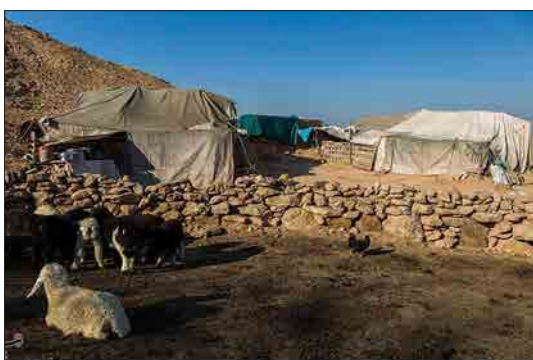
تسنیم - عشایر منطقه کریت کمپ اهواز که حدود ۲۳ خانوار هستند، از اوایل پاییز از شمال خوزستان به منطقه کریت کمپ اهواز کوچ می‌کنند و تا اوایل بهار در این منطقه می‌مانند.