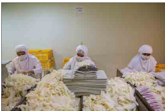
باشگاه خبرنگاران جوان - مواد اولیه لاتکس از صمغ موجود در درخت کائوچوست که در شرق آسیا وجود دارد. در فرآیند تولید دستکش‌های لاتکس ابتدا قالب‌های دست از پیش ساخته و وارد مخزن یا وان لاتکس شده و بعد به صورت آهسته خارج می‌شود تا مواد اضافی آن جدا و سپس وارد مرحله پخت شود و در نهایت توسط پرسنل از قالب جدا می‌شود، بعد از تولید، دستکش‌ها وارد مرحله تست در اتاق ایزوله شده و سپس دستکش‌های سالم وارد قسمت بسته بندی می‌شود.