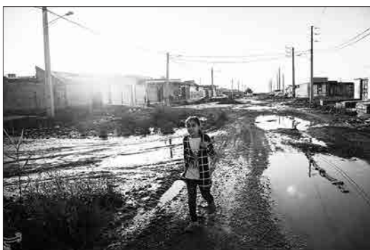
تسنیم - مشعل‌های نفتی، سال‌هاست نفس خوزستان را بند آورده‌اند، اما سرزمین‌های نفت خیز این استان رنگ آبادانی به خود ندیده‌اند. غبار محرومیت در حالی چهره خوزستان را تیره و تار کرده که کمترین سهم از این ثروت خدادادی به این مردم رسیده است. در این میان گویی مسئولیت اجتماعی نفت در مقابل جامعه و محیط زیست رو به فراموشی رفته است.