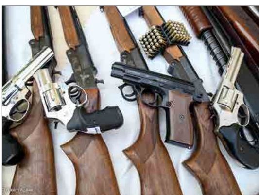
باشگاه خبرنگاران جوان - دومین مرحله از طرح «صاعقه» سه شنبه ۲۳ دی ماه ۱۳۹۹ با حضور سردار حسین رحیمی، رئیس پلیس تهران در ستاد پلیس پیشگیری تهران بزرگ به اجرا درآمد.