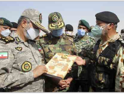
باشگاه خبرنگاران جوان - نشست خبری فرماندهان ارتش در روز پایانی رزمایش اقتدار ۹۹ با حضور امیر موسوی، فرمانده کل ارتش و امیر حیدری، فرمانده نیروی زمینی ارتش چهارشنبه اول بهمن ۱۳۹۹ برگزار شد.