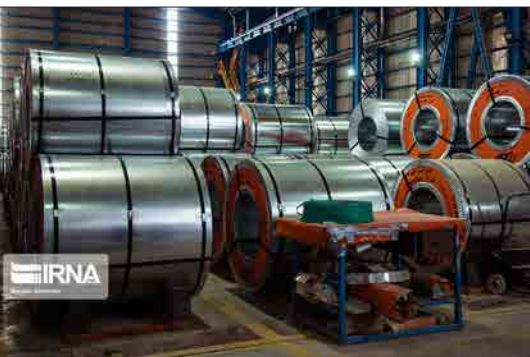
ایرنا - شهرکرد - شرکت فولاد چهارمحال و بختیاری واقع در شهرک صنعتی شهرکرد اولین تولیدکننده محصولات گالوانیزه TOC در ایران و خاورمیانه است. این شرکت در سال ۱۳۸۷ با اولویت در زمینه طراحی، ساخت و راه‌اندازی خطوط تولید فولادی (PROCESSING LINE)، تأسیس شد.