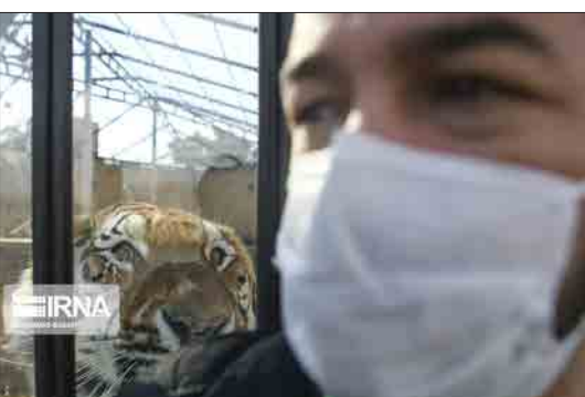
ایرنا - تهران - باغ وحش ارم تهران پس از ماه‌ها تعطیلی با رعایت پروتکل‌های بهداشتی مجدداً آغاز به کار کرد.