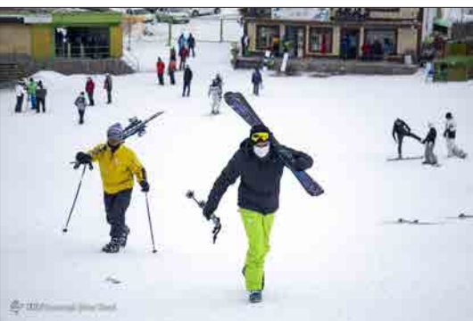
باشگاه خبرنگاران جوان - پیست اسکی دیزین در شمال کوه‌های تهران و به فاصله ۱۲۳ کیلومتر از مسیر جاده چالوس و ۷۱ کیلومتر از مسیر شمشک واقع شده است. این پیست اولین پیست اسکی در ایران است که از طرف فدراسیون جهانی اسکی برای برگزاری مسابقات رسمی تأیید شد و عنوان بین‌المللی به خود گرفت.