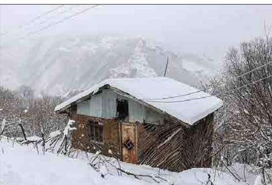
تسنیم- بارش برف سنگین در منطقه گردشگری اشکورات رحیم آباد رودسر منجر به مسدود شدن راه اصلی و فرعی شد که با کمک جمعیت هلال احمر، گروه‌های آفرودی و تلاش پرسنل راهداری، ماشین‌آلات برف‌روبی مشغول به امداد رسانی و عملیات بازگشایی جاده‌ها هستند. ارتفاع برف در ارتفاعات بالادست به ۷۰ سانتی متر رسیده است.