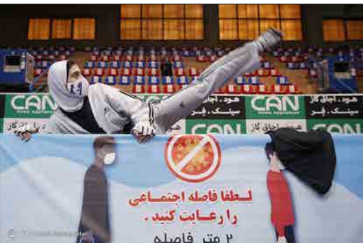
باشگاه خبرنگاران جوان - دیدارهای هفته اول تا پنجم از شانزدهمین دوره رقابت‌های لیگ تکواندو زنان «جام کوثر» یادواره دانشمندان هسته‌ای شهید «محسن فخری زاده» پنجمین دوم بهمن ۱۳۹۹ در فدراسیون تکواندو برگزار شد.