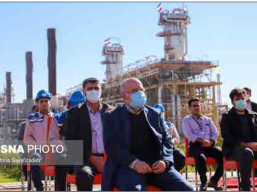
ایستگاه پالایشگاه گاز بیدبلند خلیج فارس بهمن روز پنجم دوم بهمن ماه بادستور حسن روحانی رئیس جمهوری به صورت ویدئو کنفرانس و با حضور وزیران زنگنه و زینت افتتاح شد. این پالایشگاه یکی از بزرگ‌ترین پالایشگاه‌های گاز خاورمیانه است که در بهمن ماه بهره‌برداری رسید.