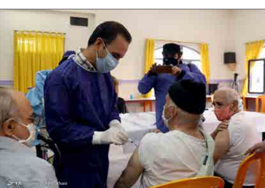
باشگاه خبرنگاران جوان - در ادامه فاز نخست واکسیناسیون علیه بیماری کووید-۱۹ و به دنبال آغاز واکسیناسیون کادر درمان، واکسیناسیون سالمندان، جانبازان و کارکنان آسایشگاه ها نیز همزمان با سالروز ولادت مولای متقیان علی (ع) پنجشنبه ۷ اسفند ۱۳۹۹ با حضور سعید نمکی وزیر بهداشت در آسایشگاه سالمندان کهریزک آغاز شد.