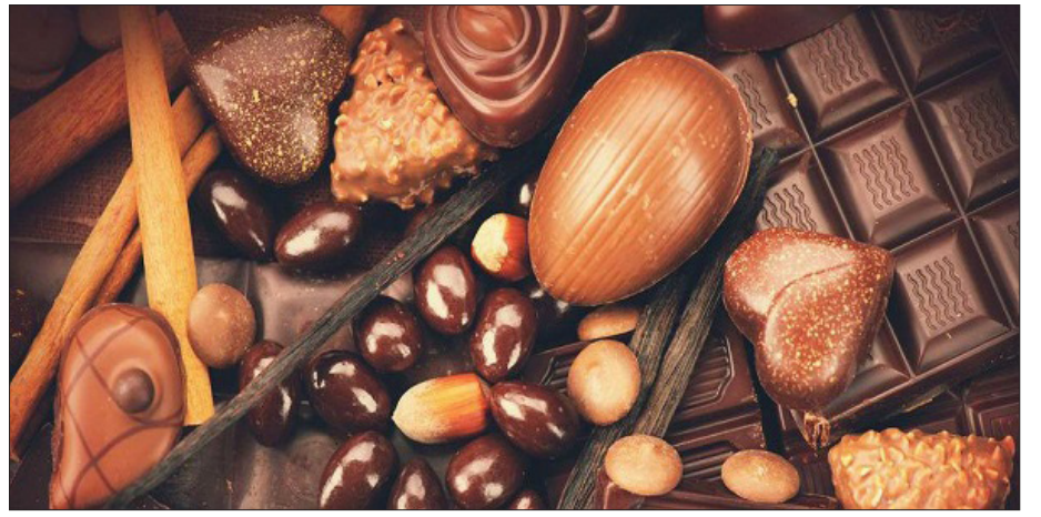
افزایش تلاش شرکت های بزرگ برای حضور در بازارهای صادراتی پس از کاهش قدرت خرید مردم