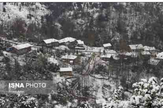
ایسنا - اینجا بخشی از طبیعت زمستانی شهرستان املش، روستای «تابستان نشین» در استان گیلان است. در بارش های اخیر، این منطقه به خاطر بارش سنگین برف، سفیدپوش شده است. بارشی که تا بامداد روز پنجشنبه ادامه داشت و در عین اینکه مناظر زیبایی خلق کرد.