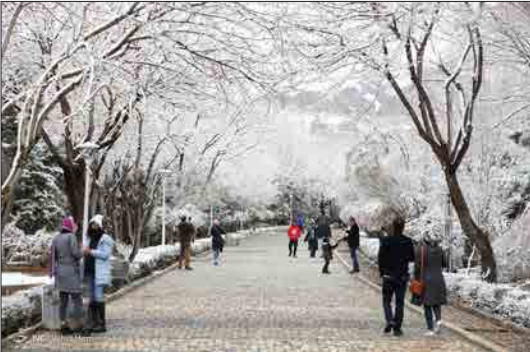
باشگاه خبرنگاران جوان - رئیس مرکز مدیریت راه های اداره کل راهداری و حمل و نقل جاده ای استان اصفهان گفت: «با وجود بارش برف در ۱۴ محور مواصلاتی استان اصفهان، تمام راه های استان باز و تردد برقرار است.»