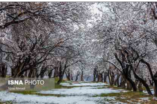
ایسنا - در روزهای پایانی بهمن ماه، با افزایش دما شاهد به شکوفه نشستن درختان بادام در شهرستان سامان استان چهارمحال و بختیاری بودیم، اما این شکوفه های زودرس با بارش برف جامه سپید برتن کردند. بارش برف و کاهش دما موجب سرمازدگی و پیروز خسارت قابل توجه به کشاورزان این منطقه به عنوان یکی از محورهای توسعه اقتصادی می شود.