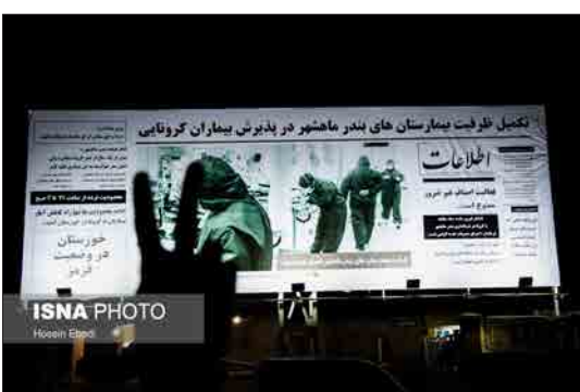
ایسنا- استان خوزستان از لحاظ رنگ بندی کرونا جزو استان های آبی (کم خطر) بود که به یکباره این وضع تغییر و در حال حاضر بیشترین شهرهای استان از جمله ماهشهر به رنگ قرمز درآمده اند. با وضع قرمز، مجدداً اعمال محدودیت های کرونا اعلام شد و براساس دستورالعمل های ابلاغ شده در شهرهای قرمز، تنها مشاغل گروه یک اجازه فعالیت دارند. در هفته جاری ۷۴ درصد موارد بیماری بیشتر از هفته قبل شده. ۴۵ درصد فوت بالا رفته و ۹۰ درصد تعداد بیماران نیز افزایش پیدا کرده است.