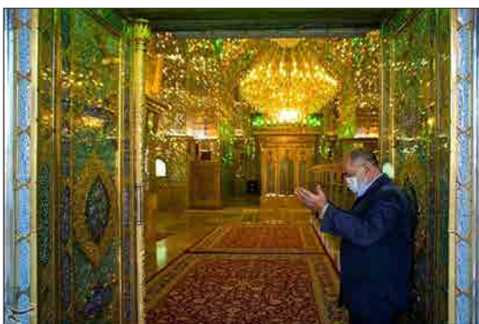
تسنیم- ۱۷ رجب سالروز بزرگداشت شهادت حضرت احمد بن موسی الکافم معروف به حضرت شاهچراغ (ع) برادر بزرگتر حضرت امام رضا (ع) است.