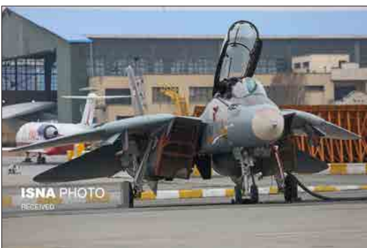
ایسنا- مراسم تحویل دهی انواع هواپیماهای نظامی، ترابری سنگین و بالگرد و همچنین ده ها موتور پیشرفته در صنایع هوایی وزارت دفاع دوشنبه ۱۱ اسفندماه با حضور امیر سرتیپ حاتمی، وزیر دفاع، امیر نصیرزاده، فرمانده نیروی هوایی ارتش و امیر یوسف قربانی، فرمانده هوانیروز ارتش برگزار شد.