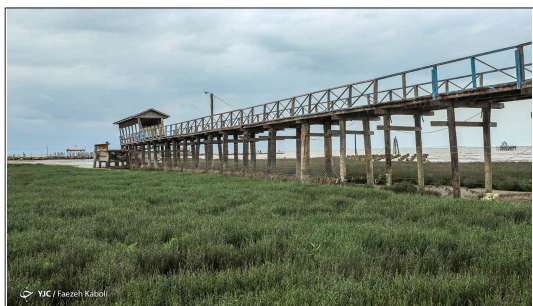
باشگاه خبرنگاران جوان - خلیج گرگان بزرگ ترین خلیج دریای خزر است که در محدوده جغرافیایی ایران و بین دو استان مازندران و گلستان قرار گرفته است. در حال حاضر درصد بسیاری از خلیج خشک شده و رو به نابودی است.