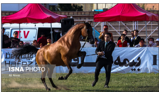
ایسنا- دومین جشنواره ملی زیبایی اسب اصیل عرب جام «ای جی داربیج» با شرکت ۱۲ اسب اصیل عرب از مناطق مختلف ایران در اردیبهرد برگزار شد.