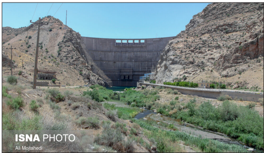
ایسنا- سد «الغدیر» ساوه با ۲۶۵ متر طول تاج و حجم ۲۷۷ میلیون مترمکعب آب از نوع دو قوسی بتونی است که در سال ۷۲ با هدف تأمین برق و آب کشاورزی ۲۲ هزار هکتار از اراضی این شهرستان احداث شد. در سال آبی جاری ورودی سد الغدیر ساوه ۷۲ میلیون مترمکعب بوده است، این در حالی است که در سال گذشته ورودی این سد ۲۲۸ میلیون مترمکعب بود. حجم ورودی سد ساوه در سال آبی جاری نسبت به سال آبی گذشته ۶۸ درصد کاهش داشته است. همچنین مخزن سد نیز در سال جاری کاهش ۳۳ درصدی نسبت به سال قبل را شاهد است.