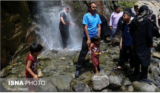
ایسنا- منطقه توریستی و گردشگری گنجانمه همدان این روزها میزبان نه فقط همدانی ها، بلکه بسیاری از هموطنان استان های گرمسیری است که به دلیل آب و هوای خنک همدان به این شهر آمده اند و بدون رعایت پروتکل های بهداشتی در حال تردد در شهر. مناطق گردشگری و... هستند. گنجانمه نام منطقه ای است که در ۵ کیلومتری شهر همدان قرار دارد و شهرت آن به دلیل داشتن آبشاری زیبا و دو سنگ نوشته از دوران داریوش و خشایارشا هخامنشی است که بر دل یکی از صخره های الوند جای دارد.