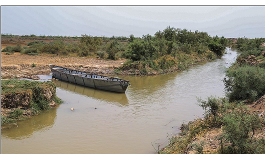
تسنیم- طی روزهای گذشته میزان خروجی سد کرخه افزایش یافته که موجب ورود آب به مخازن ورودی تالاب هورالعظیم شد.