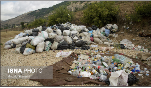
ایسنا- منطقه دودانگه ساری با قرار گرفتن در ۶۰ کیلومتری جنوب شهرستان ساری از جذاب ترین مناطق تاریخی و طبیعی شمال ایران محسوب می شود. اما دفع زباله از معضلات بسیار جدی این منطقه است. به علت نبود محلی برای جمع آوری زباله و دفع آن، بسیاری از ساکنان این منطقه زباله ها را آتش می زنند و عده ای هم زباله ها را در کنار جاده های اطراف مناطق جنگلی رها می کنند.