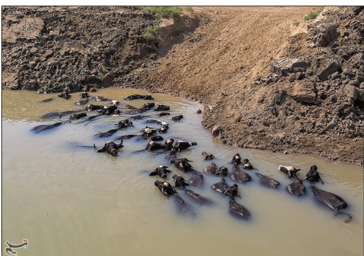
تسنیم - رهاسازی آب از سد کرخه روز چهارشنبه آب به رفیع، بستان، سوسنگرد و برخی از نقاط این شهرستان رسید. پس از روزهای آبی در رفیع آب به این شهر رسید و کانال‌های این منطقه که در هفته‌های گذشته کاملاً خشک شده بودند، دوباره پرآب شدند.