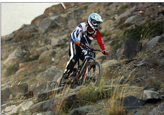
مسابقات دوچرخه‌سواری رشته دانشگاهی با شرکت ورزشکارانی از غرب کشور و استان همدان در کوهستان میدان میشان همدان برگزار شد.