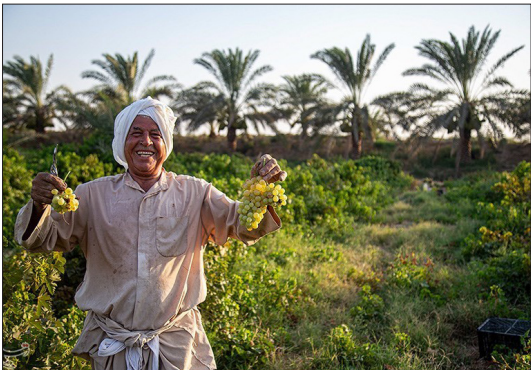
تسنیم - شهرستان کارون یکی از قطب‌های تولیدکننده انگور در استان خوزستان است در منطقه شرق کارون بسیاری از روستاییان به تولید انگور مشغول هستند و غزاویه بزرگ بیشترین سطح زیر کشت منطقه را به خود اختصاص داده است و روزانه در هر هکتار حدود ۵۰ کیلو انگور برداشت و روانه بازاری می‌شود.