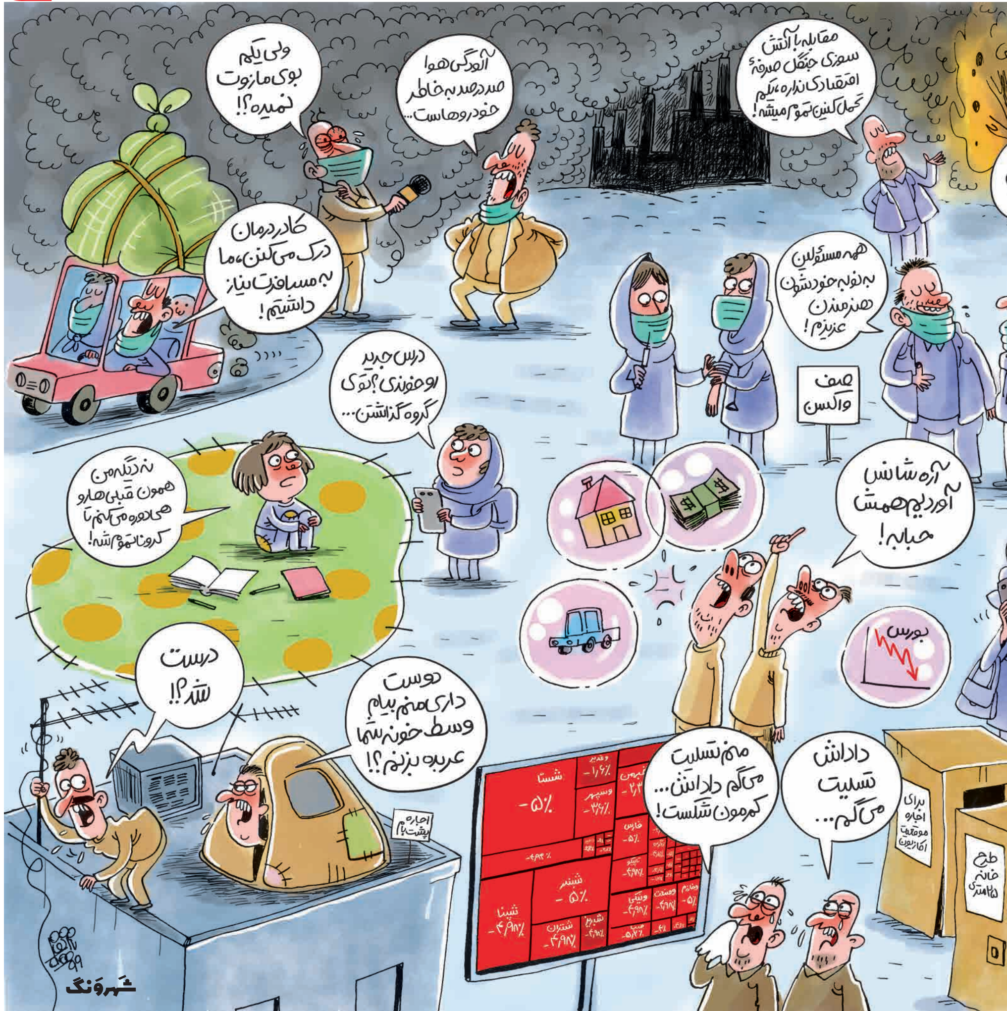
هادی حیدری کار نویس