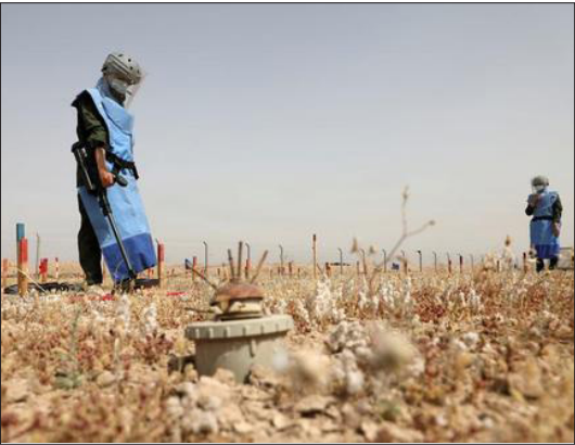
مشارکت زنان عراقی در عملیات مین روبی از زمین های اطراف شهر بصره در جنوب عراق