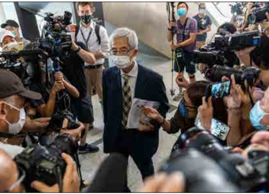
مارتین لی، وکیل سرشناس هنگ کنگی، در دادگاه ۹ فعال مبارزات دموکراسی به دلیل نقش آنان در سازمان دهی اعتراضات سال ۲۰۱۹ گناهکار اعلام شد.