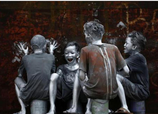
جوانانی که از سرتاپا خود را با رنگ نقره پوشانده اند، به عنوان بخشی از عمل خود برای امرار معاش در جاکارتا، اندونزی دیده می شوند.