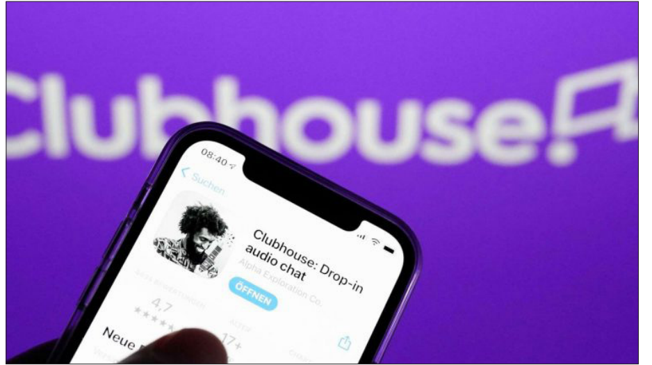
پدیده جدید فضای مجازی در نوروز ۱۴۰۰ حسابی خبرساز بود