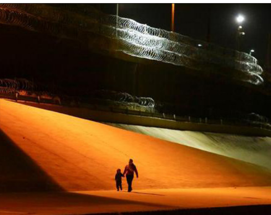
مادر و فرزند هندوآسی در مرز آل پاسو در ایالت تگزاس آمریکا در حال ورود به خاک ایالات متحده برای درخواست پناهندگی