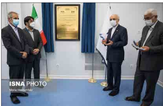
ایسنا- مراسم افتتاح مرکز ملی فناوری کوانتوم در سازمان انرژی اتمی توسط علی اکبر صالحی، رئیس سازمان انرژی هسته‌ای، ۲۳ فروردین برگزار شد.