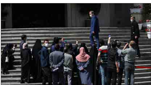
مهر- در حاشیه جلسه بیست و پنجم فروردین ۱۴۰۰ هیأت دولت تعدادی از وزرای دولت به سوالات خبرنگاران پاسخ گفتند.