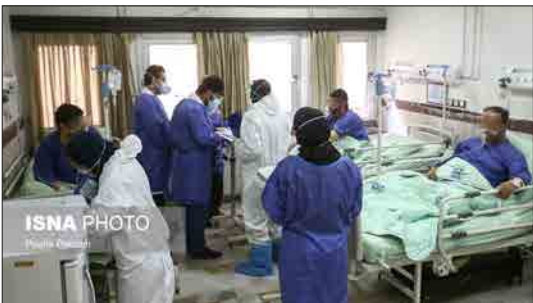
ایسنا- آمار مبتلایان به کرونا روز به روز در حال افزایش است این در حالی است که تخت‌های بخش ICU بیمارستان‌های استان همدان پر شده و تخت‌های عادی نیز در حال پر شدن هستند. ۲۵۰۰ تخت برای بیماران کووید-۱۹ در این استان در نظر گرفته شده که در حال حاضر ۱۳۳۰ بیمار در بیمارستان‌های استان بستری هستند و روزانه ۱۰۰ تا ۱۵۰ نفر نیز پذیرش می‌شوند. در شرایط کنونی تمام بیمارستان‌های همدان به جز بیمارستان بوعلی و مطهری بیماران کووید-۱۹ را پذیرش می‌کنند.