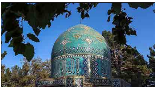
تسنیم - فریدالدین ابو حامد محمد عطار نیشابوری مشهور به شیخ عطار نیشابوری یکی از عارفان، صوفیان و شاعران ایرانی سترگ و بلند نام ادبیات فارسی در پایان سده ششم و آغاز سده هفتم است. او در سال ۵۴۰ هجری برابر با ۱۱۴۶ میلادی در نیشابور زاده شد و در ۶۱۸ هجری به هنگام حمله مغول به قتل رسید. آرامگاه عطار نیشابوری بنیابی است تاریخی که در دوره تیموری به وسیله امیر علیشیر نوایی بر روی قبر عطار نیشابوری ساخته شد. روز بیست و پنجم فروردین در تقویم رسمی کشور به نام عطار نیشابوری نامگذاری شده است.