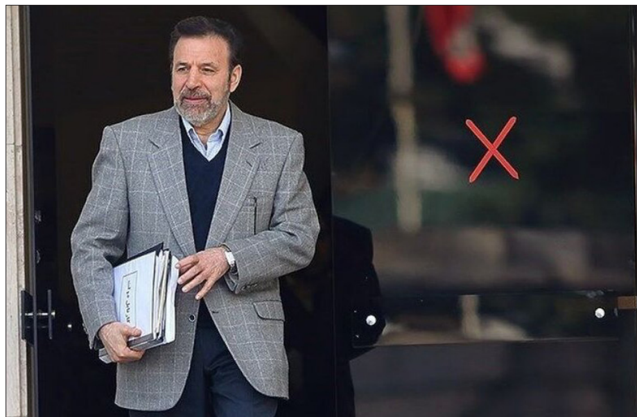
واکنش محمود واعظی به گلایه‌های وزیر بهداشت