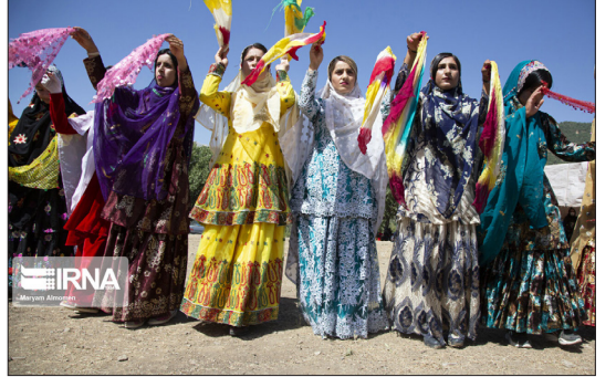
ایرنا - عروسی بختیاری در پایان فصل دروازه‌های بهار با فصل زمستان که کار زیادی نداشته باشند، برگزار می‌شود. بزرگ‌ترها در روز دست‌بوسون (مراسم تعیین زمان عروسی) با رعایت تمام جوانب و مخصوصاً آمادگی خانواده عروس، روزی را برای مراسم عروسی تعیین می‌کنند.