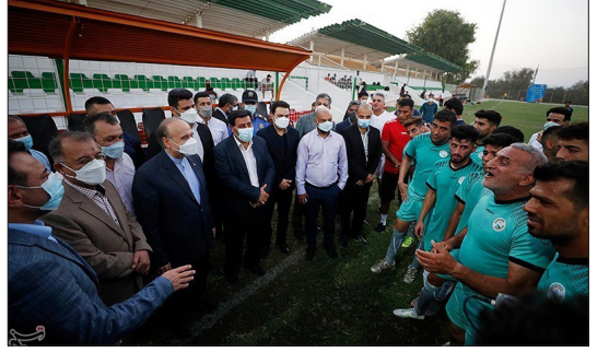
تسنیم - جلسه تمرینی تیم ملی فوتبال کشورمان در جزیره کیش، در مجموعه ورزشی المپیک این جزیره برگزار شد و وزیر ورزش نیز در این تمرینات حضور یافت.