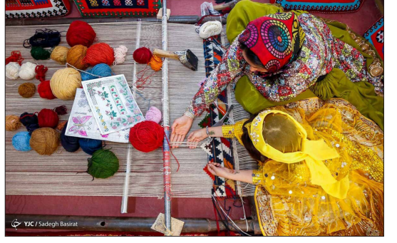
باشگاه خبرنگاران جوان - مهرگرد روستایی در شمال سیرمیر با ۳۰ خانوار و حدود ۱۰۵ نفر جمعیت است که از نظر صنایع دستی در رشته نساجی سنتی و بافته‌های داری در سطح ملی، شناخته شده است. بافته‌های داری، بافته‌هایی هستند که از دارهای عمودی یا افقی برای تولیداتی از جمله قالی، گبه، گلیم، زلیو، ورنی و شیرکی استفاده می‌شود و رنگ‌نخ‌های آن طبیعی و طرح‌های آنها برگرفته از طبیعت و فرهنگ منطقه است. در این روستا ۲۰ بافنده در ۶ کارگاه در حال بافت هستند.