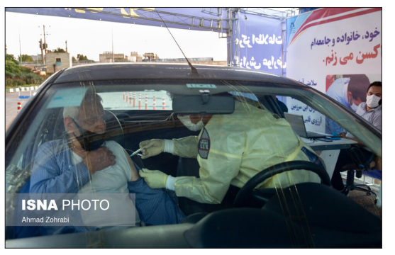
ایسنا- طرح واکسیناسیون خودروبی علیه ویروس کرونا از عصر روز یکشنبه نهم خردادماه در بلوار شهید سلیمانی قم آغاز به کار کرد. در طرح واکسیناسیون سراسری ویروس کرونا، استان قم نسبت به گروه‌های هدف در کشور با استقبال ضعیفی روبه‌رو شد و این موضوع باعث شده است که بنا بر اعلام مسئولین امر، در صورت ادامه این روند و زوایا اختصاص یافته به استان قم به شهرهای دیگر تحویل داده می‌شود.

کسری بودجه دولت آمریکا تا پایان ماه می به ۳ تریلیون و ۳۴۰ میلیارد و ۵۸۹ میلیون دلار رسیده است. به گزارش ایسنا به نقل از سایت رسمی اعلام بدهی آمریکا، میزان بدهی‌های دولت این کشور تا پایان ماه می به ۲۸ تریلیون و ۲۳۴ میلیارد و ۹۵۸ میلیون دلار رسیده است. میزان بدهی هر شهروند آمریکایی تا پایان این ماه به طور متوسط ۸۴ هزار و ۷۴۸ دلار و میزان بدهی هر مالیات دهنده آمریکایی به طور متوسط ۲۲۵ هزار و ۳۰۹ دلار بوده است. کسری بودجه دولت آمریکا تا پایان ماه می به ۳ تریلیون و ۳۴۱ میلیارد و ۵۸۹ میلیون دلار رسیده است. در حال حاضر بزرگ‌ترین اقلام بودجه‌ای آمریکا شامل: مراقبت‌های درمانی بایک تریلیون و ۳۰۷ میلیارد و ۶۲۱ میلیون دلار، تأمین اجتماعی بایک تریلیون و ۱۲۲ میلیارد و ۳۱۱ میلیون دلار، هزینه‌های دفاعی با ۷۲۶ میلیارد و ۸۸۹ میلیون دلار، بهره‌پرداختی بدهی با ۳۹۹ میلیارد و ۵۵۰ میلیون دلار است. همچنین تا پایان این ماه، میزان مجموع بدهی‌های دولتی و غیردولتی آمریکا معادل ۸۶ تریلیون و ۶۶۹ میلیارد و ۴۹۷ میلیون دلار بوده است. از این میزان، ۲۱ تریلیون و ۴۴۲ میلیارد و ۸۲۸ میلیون دلار مربوط به بدهی‌های شخصی بوده که یک تریلیون و ۷۳۲ میلیارد و ۲۹۹ میلیون دلار آن به شکل وام دانشجویی بوده است. طی این مدت، اوراق قرضه آمریکایی در اختیار کشورهای خارجی به ۷ تریلیون و ۶۷ میلیارد و ۵۲۵ میلیون دلار رسیده است.