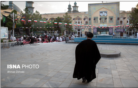
ایسنا- همزمان با ۱۵ خردادماه، مراسم گرامیداشت قیام خونین و تاریخ‌ساز یوم‌الله ۱۵ خرداد با حضور اقشار مختلف مردم شهر قم در مدرسه مبارکه فیضیه برگزار شد.