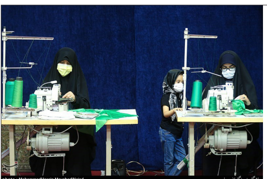
تسنیم- آیین افتتاح کارگاه دوخت لباس شیرخوارگان حسینی ظهر دیروز یکشنبه همزمان با سالروز شهادت امام جعفر صادق (ع) در مسجد النبی (ص) مرزداران برگزار شد.