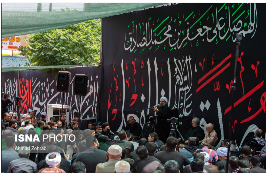
ایسنا- همزمان با سالروز شهادت امام جعفر صادق (ع)، مراسم عزاداری رئیس مذهب تشیع در خیابان شهدای قم و با حضور آیت‌الله وحید خراسانی از مراجع عظام تقلید برگزار شد.