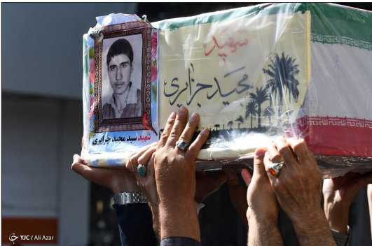
باشگاه خبرنگاران جوان- مراسم تشییع و تدفین پیکر پاک شهید «مجدد جزایری» فارسانی، پس از ۳۷ سال مفقودی، یکشنبه ۱۶ خردادماه ۱۴۰۰ با حضور خانواده و دوستان شهید در شاهین شهر اصفهان برگزار شد. شهید مفقودالاثر «مجدد جزایری» فارسانی که ۶۳ سال ۶۳ عملیات بدر به شهادت رسیده بود، پس از ۳۷ سال به تازگی در منطقه عملیاتی جزیره مجنون کشف و شناسایی شد و به میهن اسلامی بازگشت.