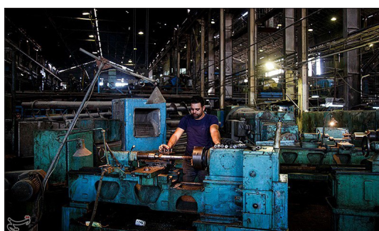
تسنیم - با تصمیم دولت در تاریخ ۱۸ مهرماه شرکت توسعه نیشکر، مدیریت شرکت نیشکر هفت تپه را به عهده گرفت. با توجه به برنامه ریزی برای اورهال کارخانه، برنامه برداشت از ابتدای دی ماه خواهد بود. در حال حاضر ۲ ماهه حقوق معوق (تیر و مردادماه) کارگران نیشکر هفت تپه به آنها پرداخت شده است.