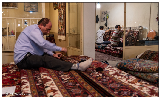
باشگاه خبرنگاران جوان - پرداخت فرش و تابلو فرش عبارت است از گرفتن برزهای سطح فرش به نحوی که سطح فرش صاف و بدون برآمدگی یا فرورفتگی باشد، به عبارت ساده تر پرداخت فرش همانند روگیر فرش می باشد که جزو مراحل نهایی تولید تابلو فرش دستبافت به شمار می آید. عملیات پرداخت فرش، زمانی انجام می شود که فرش کاملاً بافته شده و از دار قالی پایین کشیده شده است.