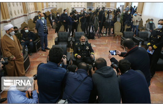
ایرنا - امیر دریادار «شهرام ایرانی» فرمانده نیروی دریایی ارتش جمهوری اسلامی ایران روز شنبه به مناسبت هفتم آذر (روز نیروی دریایی ارتش) در نشست خبری به سوالات خبرنگاران پاسخ داد.