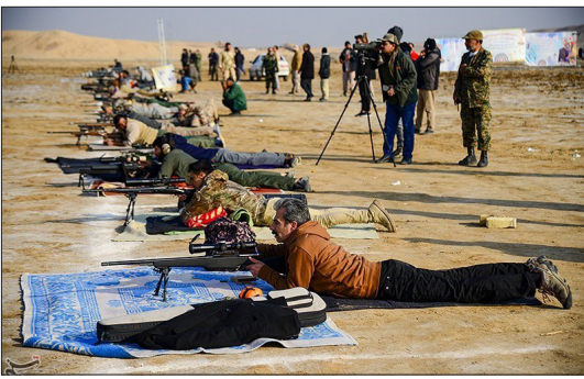
تسنیم - دومین دوره مسابقات تیراندازی آزاد کشور به مناسبت گرامی داشت هفته بسیج در شهر قنات قم برگزار شد.