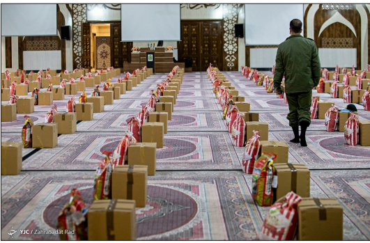
باشگاه خبرنگاران جوان - ششمین مرحله رزمایش کمک مومنانه نیروی انتظامی صبح دپروز شنبه ۶ آذر ۱۴۰۰ با حضور سردار رحیمی، فرمانده نیروی انتظامی برگزار شد.