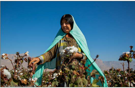
باشگاه خبرنگاران جوان - برداشت محصول پنبه از ۵۵۰ هکتار مزارع پنبه شهرستان داراب آغاز شده است. محصول پنبه داراب به دلیل شرایط آب و هوایی منطقه به جهت نازکی و لطافت از مرغوب ترین نوع در ایران است. مهم ترین ارقام پنبه کشت شده در شهرستان شامل گلستان، ساجدی، ماکسا و لیدرا است. در کارخانه پنبه بعد از جداسازی انواع پنبه آنها را بر اساس کیفیت فشرده می کنند و برای مصارف مختلف به کارخانه های ریسندگی و نساجی به سراسر کشور ارسال شده و ضایعات آن برای خوراک دام استفاده می شود.