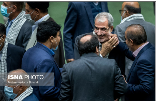
جلسه رأی اعتماد به یوسف نوری، وزیر پیشنهادی آموزش و پرورش، صبح یکشنبه هفتم آذرماه، به ریاست محمدباقر قالیباف، رئیس مجلس با حضور محمد مخبر، معاون اول رئیس‌جمهوری به‌منظور دفاع از وزیر پیشنهادی آموزش و پرورش و تعدادی از وزیران کابینه سیزدهم برگزار شد.