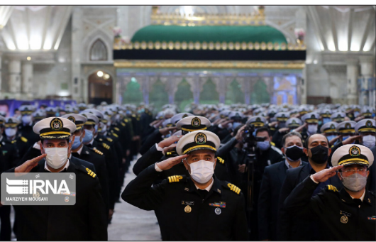
ایرنا - امیر دریادار «شهرام ایرانی» فرمانده نیروی دریایی ارتش جمهوری اسلامی ایران به همراه فرماندهان و کارکنان مناطق این نیرو روز یکشنبه به مناسبت هفتم آذرماه (روز نیروی دریایی) با آرمان‌های بنیانگذار انقلاب اسلامی تجدید میثاق کردند.