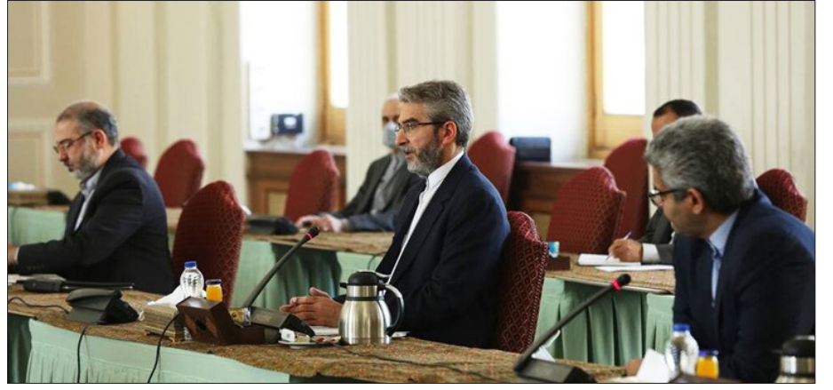
تیم مذاکره کننده ایرانی در وین بانزکیبی کامل مصمم برای کسب نتیجه است