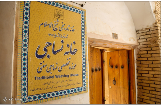
باشگاه خبرنگاران جوان - خانه تاریخی «شیخ الاسلام» که اکنون به موزه نساجی یا «خانه نساجی اصفهان» معروف است، به مساحت ۱۴۵۵ مترمربع از بناهای دوره صفویه و هدی شاه عباس به دخترش «سرو قد خانوم» و دامادش «محقق سبزواری» از علمای بزرگ آن عصر است. بعدها شیخ الاسلام که از علمای بزرگ زنجان در این محل سکنی گزید، مرمت این بنا در سال ۱۳۷۵ آغاز شد و در سال ۱۳۸۹ موزه نساجی در آن تأسیس شد.