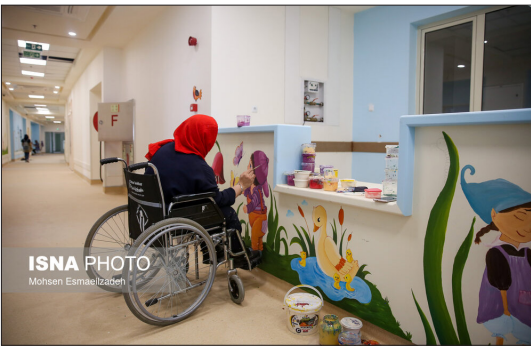
ایسنا- بیمارستان خیرساز ناظران وابسته به انجمن خیریه حمایت از بیماران سرطانی مشهد، از سال ۱۳۹۴ آغاز به احداث کرد و در بهمن ۱۳۹۹ افتتاح شد. این بیمارستان تخصصی درمان و پیشگیری سرطان در زمینی به مساحت ۱۸ هزار و ۵۰۰ مترمربع با ۲۰۰ تخت بستری و زیربنای ۲۹ هزار مترمربع با امکانات مدرن ساخته شده است. بیمارستان ناظران در بخش‌های هماتولوژی، انکولوژی، جراحی، شیمی درمانی سربایی، درمانگاه‌های تخصصی و سایر بخش‌های پاراکلینیکی شامل MRI، انواع سی تی اسکن، سونوگرافی، رادیولوژی، آزمایشگاه... ارائه خدمت می‌کند.