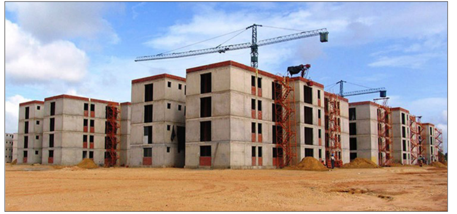
۱۵ آذر؛ آغاز عملیات ساخت ۶۱۵ هزار واحد مسکونی در شهرهای جدید