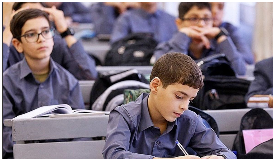
کلاس های دانشگاه تهران، شهید بهشتی و صنعتی خواجه نصیرالدین طوسی مجازی شد