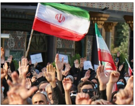
اسلامی ایران، هتک حرمت حجاب بانوان، تخریب اموال عمومی و سلب امنیت مردم اعلام داشتند.