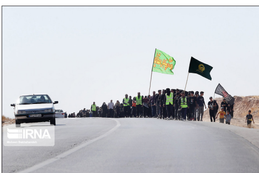
ایرنا- هر ساله با فرا رسیدن دهه پایانی ماه صفر و ایام شهادت حضرت امام رضا(ع)، زائران زیادی با پای پیاده از نقاط مختلف کشور راهی مشهد مقدس و زیارت امام هشتم می شوند.