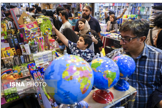
ایسنا- با توجه به شروع ماه مهر و بازگشایی مدارس، خانواده ها برای تهیه لوازم مورد نیاز فرزندان محصل خود به بازار لوازم التحریر آمده و رونق دیگری به این بازار بخشیده اند.