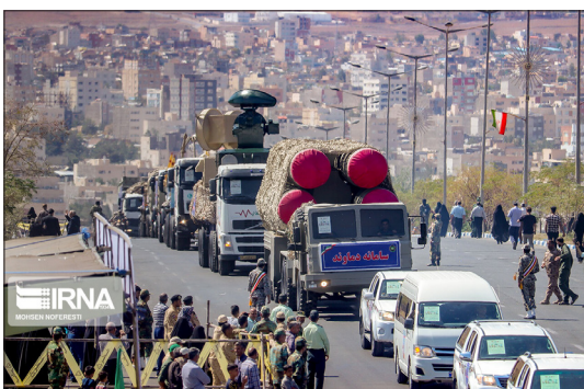
ایرنا- همزمان با آغاز هفته دفاع مقدس، مراسم رژه نیروهای مسلح صبح پنجشنبه گذشته به صورت همزمان در سراسر کشور برگزار شد.